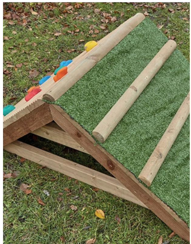
Mini rampa de escalada

Rampa de escalada con césped para los más pequeños. Los niños ganan confianza y mejoran la estabilidad. También desarrollan la motricidad gruesa a través del agarre. Cuenta con lados alternos para trepar de diferentes maneras. Medidas: 59x80x144 cm. (alto x ancho x largo).