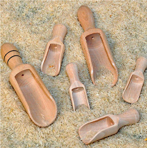
Pack 9 cucharas mezcladoras

Juego de 6 pequeñas cucharadas de madera para mezclar, revolver y jugar con pala. Desarrollo de la motricidad fina. Los tamaños varían de 8 a 17 cm.