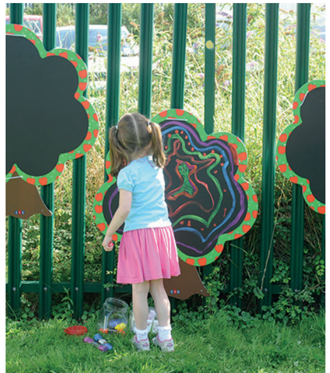
Juego de 3 pizarras: árboles

Juego de 3 árboles pizarra. Bordes cargados de manzanas rojas y carnosas. Fomenta la participación de los niños y su creatividad durante todo el año. Fabricado en Foamex impermeable, solo tienes que fijarla a la verja o las paredes a través de los orificios ya perforados. Incluye presillas para fijarlas a la verja. Dimensiones: 100 x 80 cm. (altura x anchura).