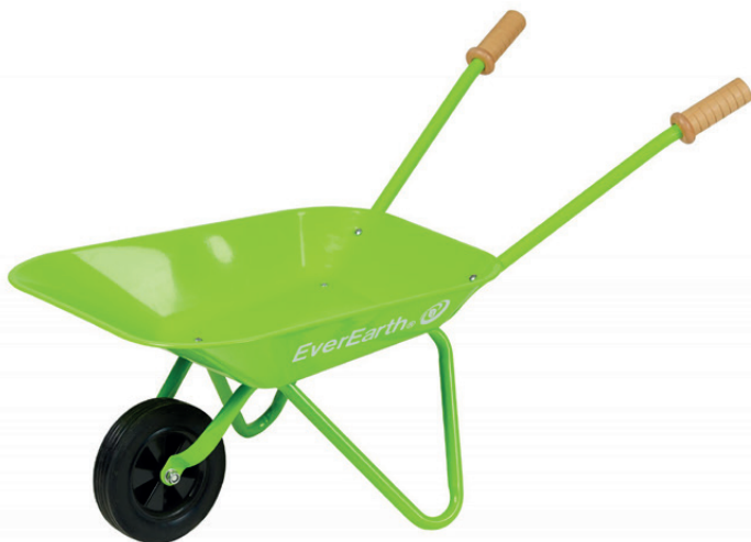
Carretilla jardinería Everearth