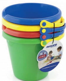
Cubo arena Ø18,5cm.

Cubo de estructura reforzada y fabricado con plásticos muy fuertes y resistentes. Diseño de línea limpia y sencilla. Especialmente indicado para uso colectivo. Se venden por separado. Colores surtidos.