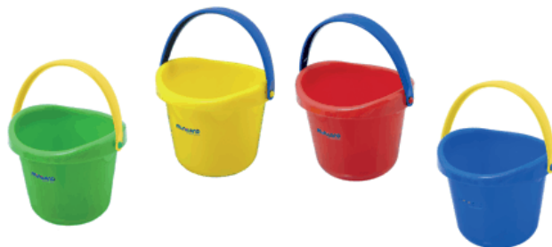
Cubo arena bebé Ø12 cm.

De estructura reforzada y fabricado con plásticos muy fuertes y resistentes. Diseño de línea limpia y sencilla. Especialmente indicado para uso colectivo.