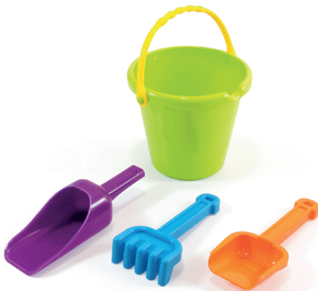
Set arena junior

Set que incluye cubo, pala, pala harinera y rastrillo. Todas las piezas pueden agruparse en el cubo.