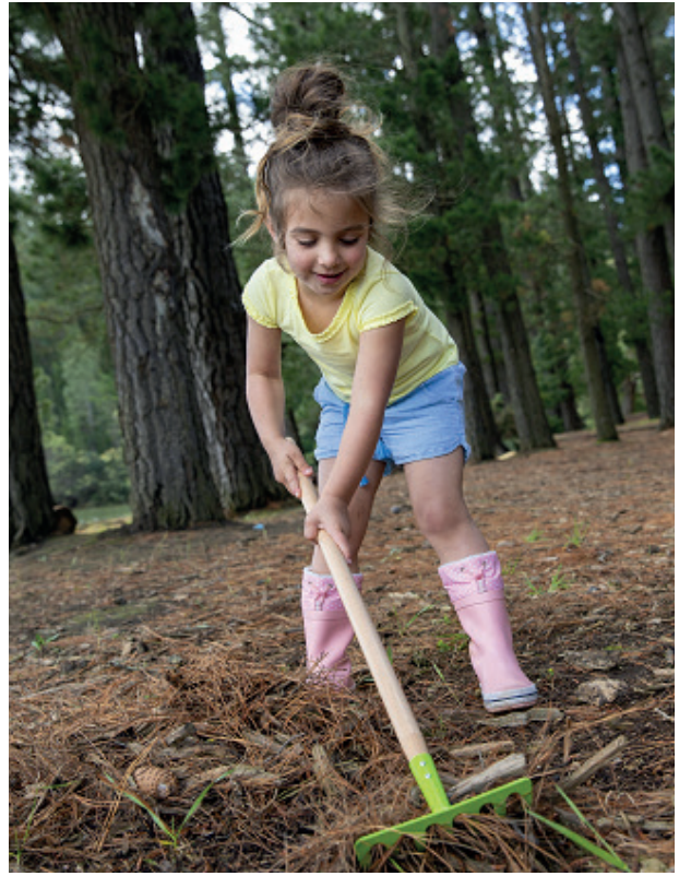
Rastrillo jardinería Everearth