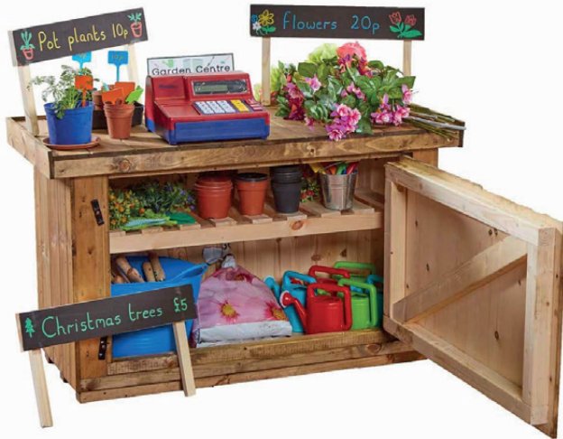
Armario de juegos

Un módulo de madera para macetas u otros elementos con armario de almacenamiento integrado. Útil para todo tipo de cosas, no solo para artículos de jardinería. ¿Por qué no crear una estación de almacenamiento de escritura o arte o una mini estación de investigación? Genial cuando necesitas mantener las cosas seguras al aire libre. Medidas: 35x100x30 cm. (ancho x alto x profundo). * Accesorios no incluidos.