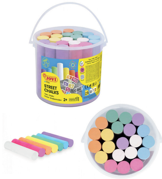
Tizas Classcolor Street Jovi cubo 20 u.

Tizas para suelo. Se elimina con agua. Cubo de plástico con 20 tizas (2 blancas y 3 unid. de cada de rojo, azul, amarillo, verde, naranja y violeta).