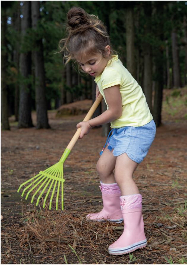
Rastrillo hojas jardinería Everearth