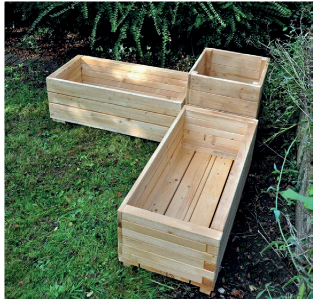
Kit 3 jardineras esquineras

Módulo de 3 jardineras, 2 jardineras rectangulares y 1 más pequeña. Ideal para poder ubicarlo en una esquina de tu patio. Ideal para desarrollar actividades mediante el aprendizaje de la siembra y la cosecha. Los alumnos también pueden desarrollar sus dotes artísticas pintando las jardineras. También se pueden añadir espejos con diferentes formas para decorarlas. Medidas: Grande: 90x40 x30 cm. (largo x ancho x alto). Pequeño: 40x40x60 cm. (largo x ancho x alto).