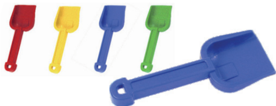
Pala 24 cm. MD29038

Pala especial a prueba de golpes y de cualquier tipo de carga. Mango grueso y fuerte. Especialmente indicado para uso colectivo.