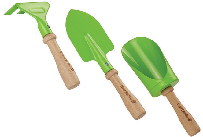
Juego 3 herramientas