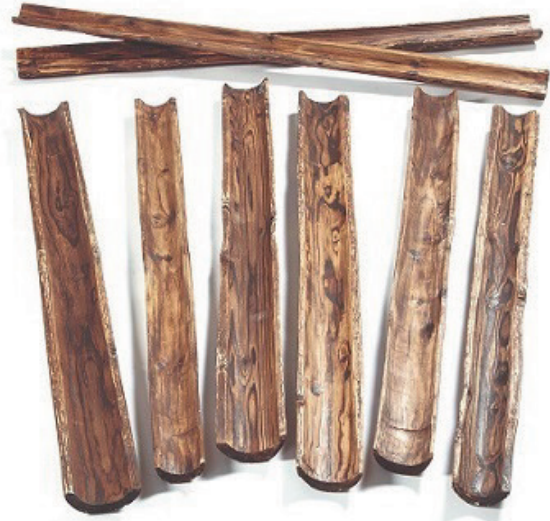
Canalización agua madera 8 u.

Estos canales naturales hechos de madera son perfectos para jugar con el agua o experimentar con la fuerza. Estos preciosos canales de agua de madera serán un complemento fantástico para el juego con agua en el exterior. Fabricado de madera envejecida para garantizar la resistencia al agua. Packs de 8 unidades de 95 cm. cada unidad.