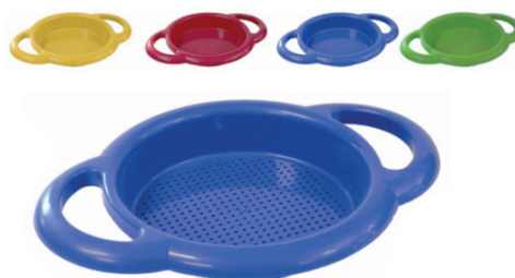
Cedazo especial Ø19 cm.

Cedazo con gran cuerpo y doble asa para facilitar su manipulación.