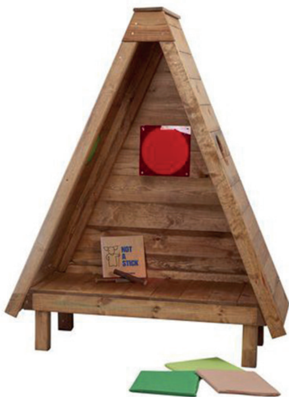
Tipi de madera para exterior

La versión de la cabaña tipi, ahora en madera para exterior. Este refugio completamente abierto permite a los más pequeños disponer de un lugar seguro desde el cual pueden observar y compartir tiempo y actividades. Excelente para apoyar el desarrollo social y emocional. Añade almohadas, libros y alguna manta para convertirlo en un agradable rincón de lectura. Medidas: 160x137x56 cm. (alto x ancho x profundidad)