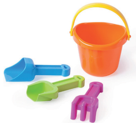
Set Arena baby

Set para jugar en arena y nieve. Dispone de cubo, pala, rastrillo y pala harinera para Bebé. Proporciones adaptadas para los más pequeños. Máxima resistencia y durabilidad. Especialmente indicado para uso colectivo.