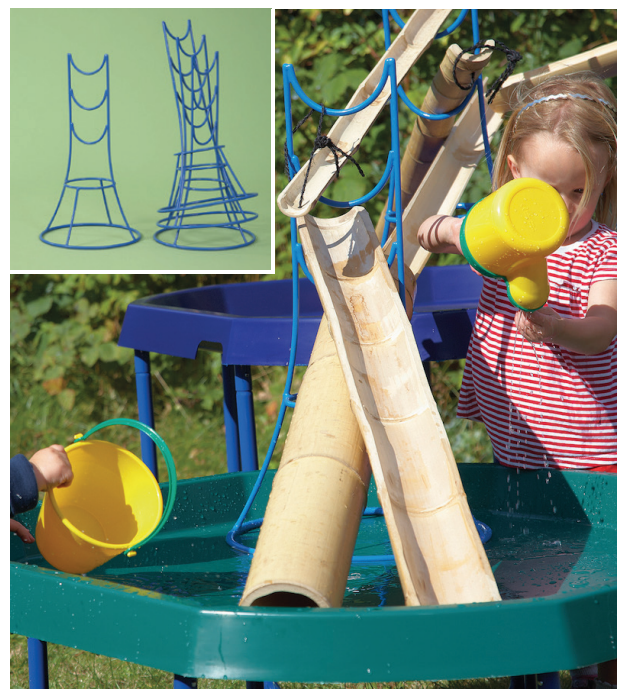
Soportes canalización agua

Este juego de cuatro soportes resistentes de metal. Es multifuncional y puede utilizarse para conectar tubos, usar los canales de agua, hacer tiendas de campaña, como estructuras para tejer, etc.