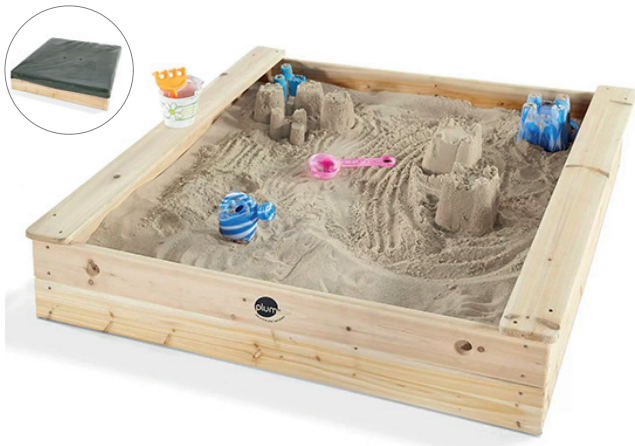
Arenero de madera con funda

Este arenero de madera fomentará el juego sensorial creativo y desordenado mientras los pequeños disfrutan vertiendo, acariciando, tamizando y removiendo la arena. Hecho de madera con sello certificado FSC. El arenero es fuerte y robusto, con dos asientos de madera incorporados en los laterales. Incluye una lona para el suelo y una funda protectora. Medidas: 113 x 113 x 23 cm.