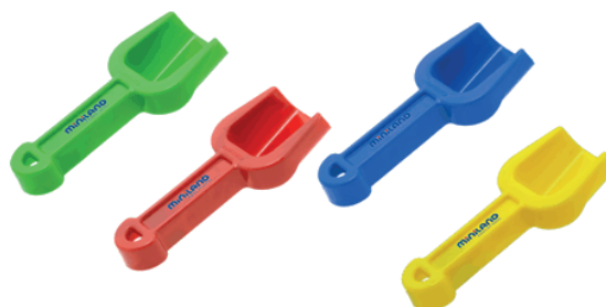
Pala bebé 14 cm.

A prueba de golpes y de cualquier tipo de carga. Mango grueso y fuerte. Especialmente indicado para uso colectivo.