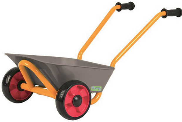
Carretilla infantil metálica

Carretilla metálica de sólido chasis y de 2 ruedas que la mantienen estable. Bandeja reforzada y protegida. Amplio espacio de carga. Empuñaduras de goma maciza. Manejo seguro por los niños más pequeños. Soporta 50 Kg de peso. Medidas: 40,5 x 71 x 38 cm.