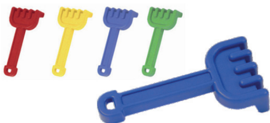
Rastrillo 20 cm. MD29039

Rastrillo máxima resistencia y durabilidad. Mango reforzado. Especialmente indicado para uso colectivo.