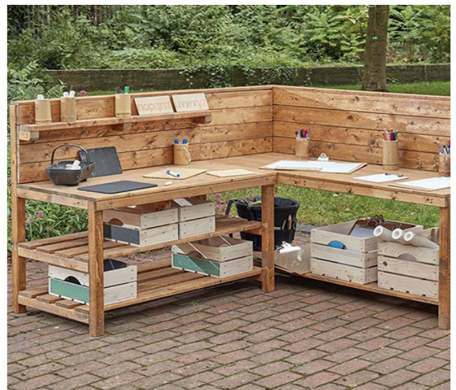
Corner para espacio de juego

Un encantador y versátil espacio de aprendizaje al aire libre. La mesa está diseñada para poder usarse como cocina, área de escritura o como parte de un área de juego simbólico. Incluye mucho espacio para almacenar una variedad de recursos. Medidas: 65 cm. Altura de la mesa de trabajo. Bloque pequeño: 105x108x60 cm. (altura x anchura x profundidad). Bloque grande: 105x155x60 cm.