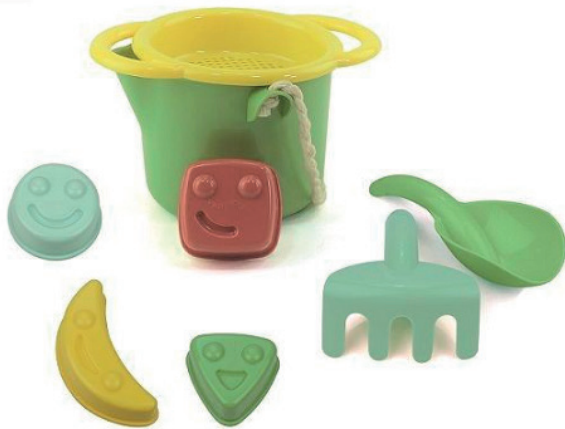
Ecoline Sand bucket set

Conjunto de cubo, pala, rastrillo y moldes, para jugar y experimentar con agua y arena. Producto eco-friendly, hecho con caña de azúcar. Medidas del cubo: 15,8x16,8x11 cm.