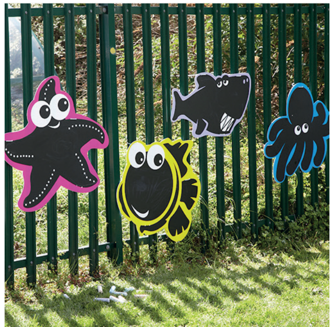
5 pizarras garabatos arrecifes

Dimensiones: 74x74 cm. (altura x anchura).