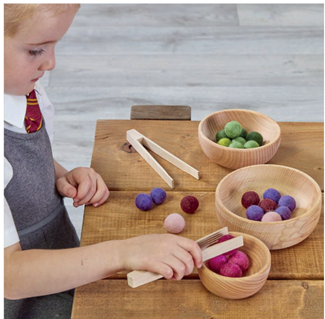
Comer para espacio de juego

Estos boles de madera son muy agradables al tacto y estéticamente atractivos. Tienen 3 tamaños y son apilables. Puedes separar diferentes elementos, formas, colores y realizar juegos de asociación así como de motricidad fina si se utilizan pinzas. Diámetro más grande de 15 cm.