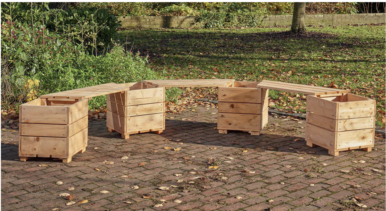
Bancos con jardineras (6 personas)