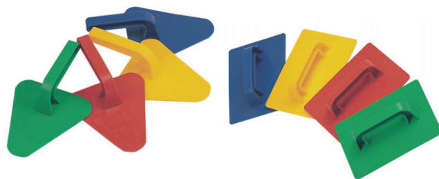
Paletas 18 cm. MD29030