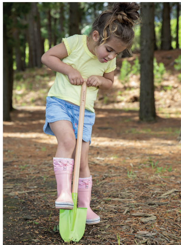
Pala jardinería Everearth