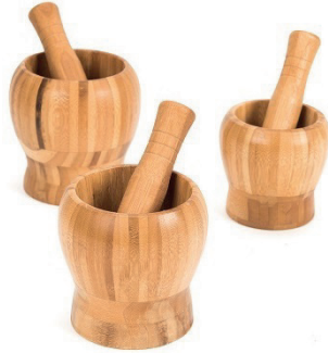
Juego mano y mortero

Juego de 3 morteros de diferentes tamaños. Los niños se divertirán haciendo brebajes creativos en estos tres recipientes de madera. Medidas: Pequeño: parte superior Ø10 cm. x parte inferior Ø9 cm. x 12 cm. altura. Mediano: parte superior Ø9 cm. x parte inferior Ø9 cm. x 11 cm. altura. Grande: parte superior Ø8 cm. x parte inferior Ø8 cm. x 9 cm. altura.