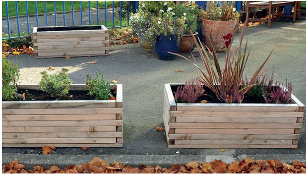
Kit 4 jardineras rectangulares

Conjunto de 4 macetas sencillas y resistentes para los patios de las escuelas. Gran tamaño para que varios alumnos pueda trabajar grupalmente. Ideales para desarrollar diferentes actividades mediante el aprendizaje de la siembra y la cosecha. Los alumnos también pueden desarrollar sus dotes artísticas pintando las jardineras. Medidas: 90 x 40 x 30 cm. (largo x ancho x alto).