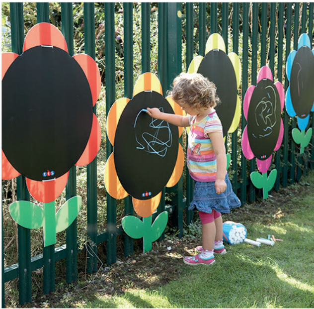
5 Pizarras margaritas

Dimensiones: 100x80 cm. (altura x anchura).