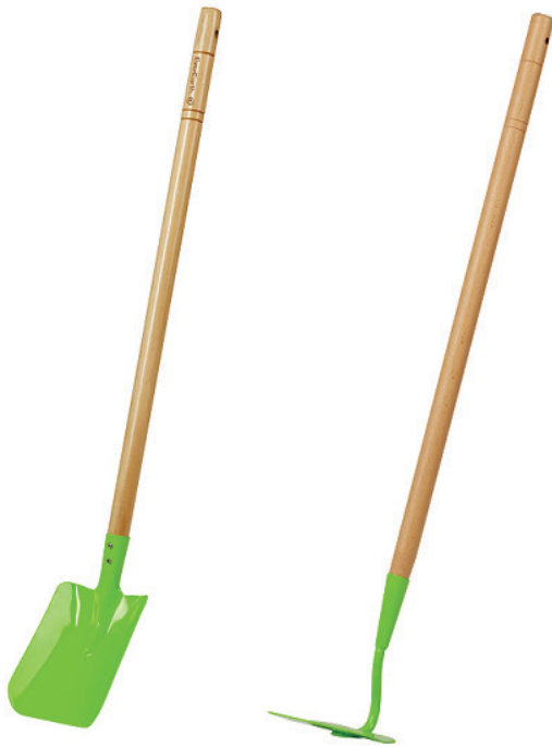
Pala jardinería Everearth