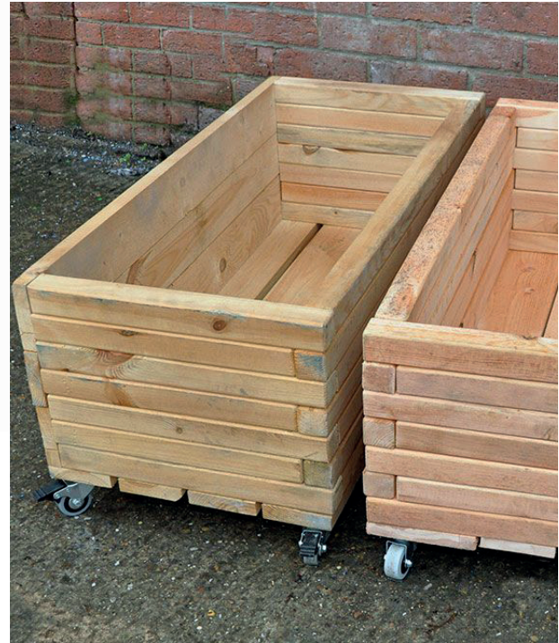
2 Jardineras rect. con ruedas

Conjunto de 2 jardineras rectangulares con ruedas, resistentes y fáciles de transportar. Ideales para desarrollar diferentes actividades mediante el aprendizaje de la siembra y la cosecha. Los alumnos también pueden desarrollar sus dotes artísticas pintando las jardineras. También se pueden añadir espejos con diferentes formas para decorarlas. Medidas: 90x40x30 cm. (largo x ancho x alto).