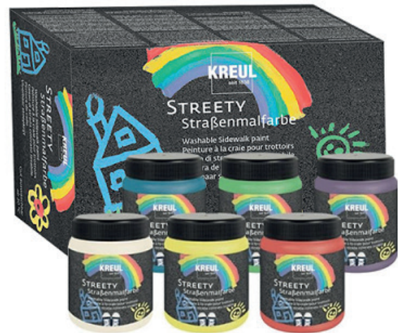
Pintura tiza asfalto Kreul 200 ml.

Con la pintura Streety de Kreul, la fiesta está asegurada. Pinta en el asfalto todo lo que quieras, desde grandes dibujos, líneas para juegos, figuras. Perfecto para que los peques desarrollen su faceta de artista callejero. Pero no te preocupes, esta pintura no es para la eternidad. Aplicando agua, se quitará con poco tiempo.