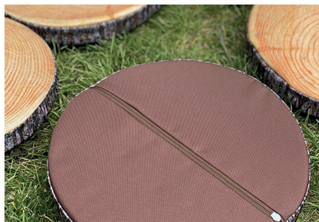
Cojín rodajas de tronco 8 u.