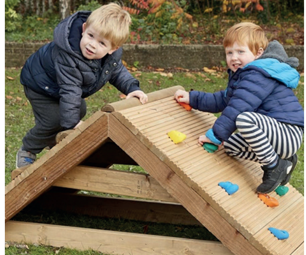
Mini rampa de escalada

Rampa de escalada para los más pequeños. A través de la escalada, los niños ganan confianza y mejoran la estabilidad. También desarrollan la motricidad gruesa a través del agarre. Medidas: 59x80x145 cm. (alto x ancho x largo).