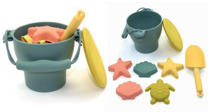
Set de playa de silicona Ob Designs

Juego de playa en silicona alimentaria. Contiene un cubo, una tapa, 1 pala y 5 moldes para jugar: 2 estrellas, 2 conchas y 1 tortuga. Está fabricado con silicona derivada de la arena.