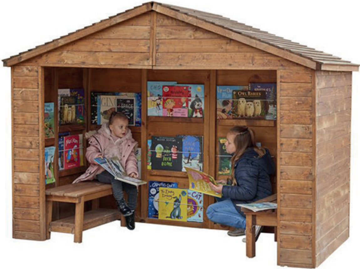
Biblioteca al aire libre

Un espacio de biblioteca al aire libre con estanterías, para disponer las mejores lecturas ilustradas infantiles u otros elementos. Añade cojines, bancos y mantas para hacer de este espacio un rincón acogedor y hacer de esta experiencia una excelente manera de fomentar la lectura y la interacción entre los más pequeños. Medidas: 160x137x56 cm. (alto x ancho x profundidad).