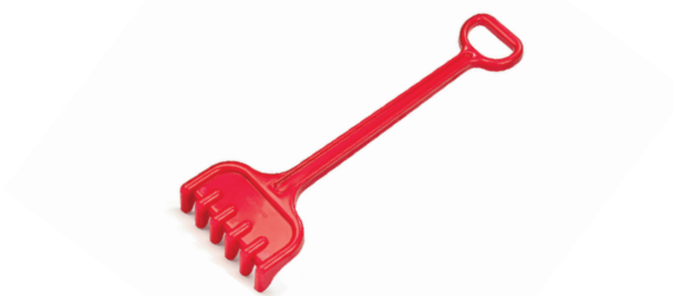
Rastrillo súper 50 cm. MD29084

Rastrillo de gran tamaño, súper resistente y máxima durabilidad. Mango extra-largo y estructura reforzada. Alto rendimiento para uso colectivo.