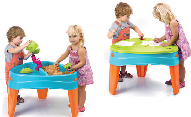
Arenero Feber Play Island