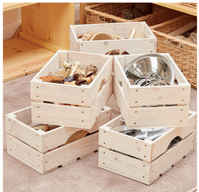
Cajas almacenaje. Pack 6