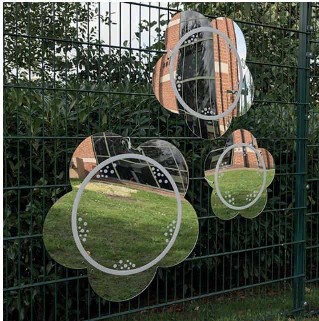
Juego 3 Espejos Margaritas