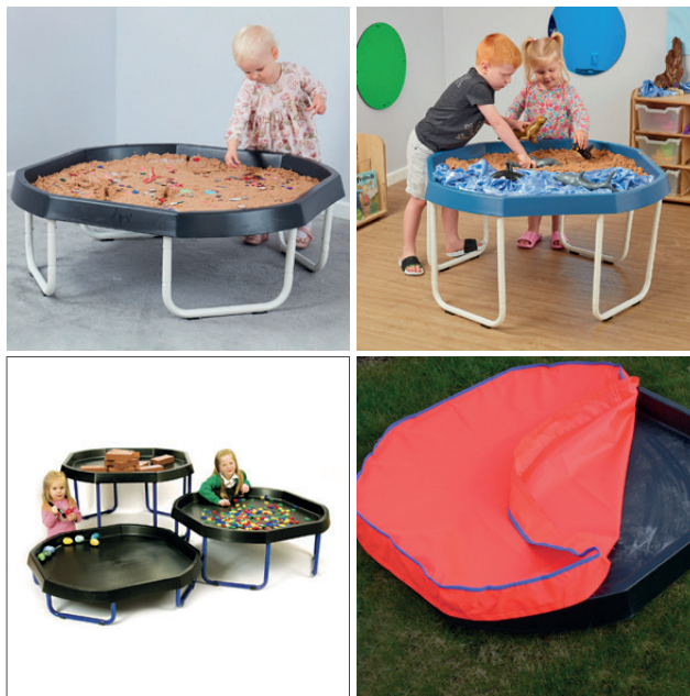
Soporte mundo activo

Compra un único soporte ajustable para nuestras Bandejas Mundo activo o disfruta de un precio reducido comprando a la vez un paquete de 3. El soporte se puede ajustar a 4 alturas diferentes: 20, 30, 40 y 50 cm. La funda se vende por separado.