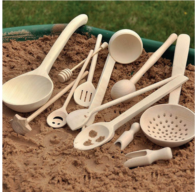
Juego 12 utensilios cocina madera

Un maravilloso juego de diferentes utensilios de cocina de madera. Los interesantes diseños y formas de estos, los hacen perfectos para que los niños más curiosos los exploren. Se pueden utilizar también para juegos de agua y arena. Los tamaños varían de 9 a 45 cm.