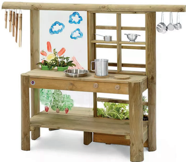
Cocinita de madera exterior

Inspiradora, creativa, natural y bonita: así es esta cocinita de madera para exterior, con la que los peques podrán preparar sus delicatessen en medio del bosque o el jardín. Incorpora una pantalla para pintar o anotar el menú del día, un móvil de viento y una maceta para que puedan cultivar sus propias frutas, legumbres o plantas aromáticas. Dimensiones: 160 x 70 x 115 cm.