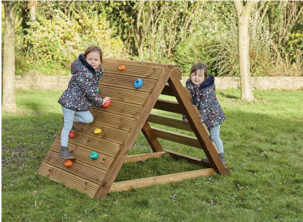
Rampa de escalada

Rampa de escalada que brinda a los más pequeños la oportunidad de trabajar su desarrollo físico y emocional al mismo tiempo. También desarrollan la motricidad gruesa a través del agarre. Cuenta con lados alternos para trepar de diferentes maneras. Medidas: 103x150x100 cm. (alto x ancho x largo).