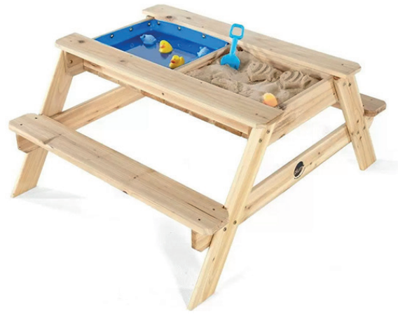
Mesa picnic y arenero madera

La mesa de picnic de arena y agua introducirá a los más pequeños al juego creativo con arena y agua. La mesa de actividades de madera incluye una tapa de madera resistente para convertirla nuevamente en un banco de picnic para cenar al aire libre. Hecho de madera (sello certificado FSC) de abeto chino resistente para durar muchos años. Medidas: 105 x 89 x 49 cm. (longitud, anchura, altura).