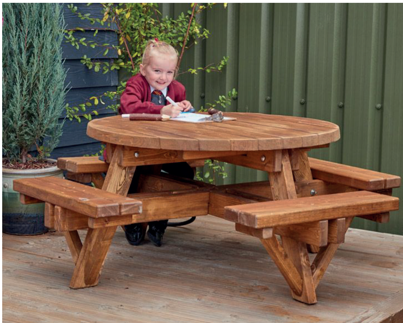
Bancos pícnic redondo para 8

El lugar perfecto para el trabajo colaborativo. Este acogedor banco de picnic de ocho plazas ofrece la posibilidad de realizar actividades grupales en el exterior. También es ideal para comer al aire libre.