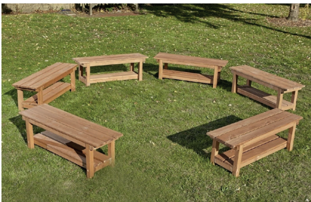
Kit de 6 bancos para exterior

Conjunto de 6 bancos para un grupo de hasta 18 niños/as. Diseñados para promover el aprendizaje al aire libre. Estos bancos naturales permitirán que grupos más grandes se sienten al aire libre para demostraciones o lectura de cuentos. Medidas: 35 x 100 x 30 cm. (alto x largo x ancho).