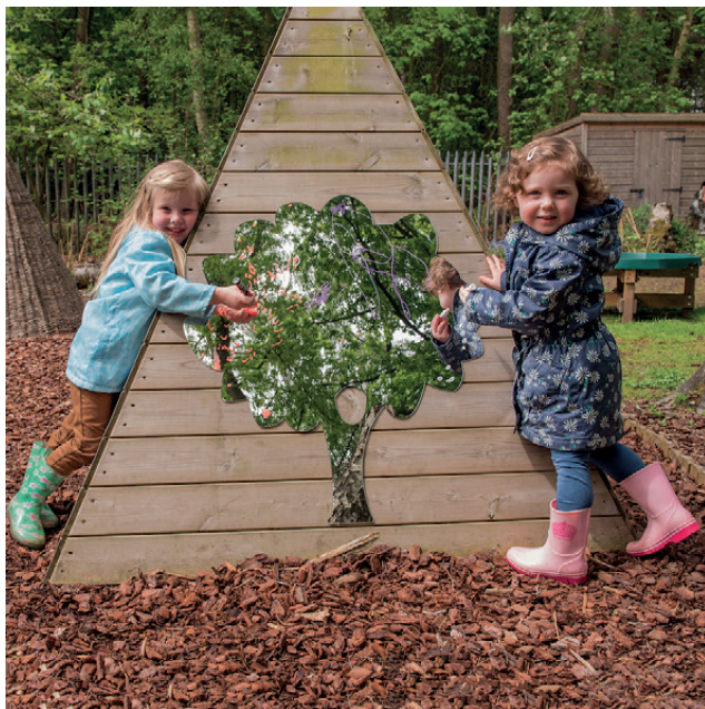
Juego 3 Espejos Árboles