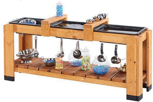
Mesa sensorial experimentación

Esta mesa sensorial de experimentación es el complemento perfecto para las áreas de cocina con agua, arena o barro, para fomentar la observación de todos los sentidos. Incluye tazones robustos recubiertos de goma para añadir artículos húmedos, áreas para guardar tazones y cajas y ganchos para guardar utensilios para explorar. Medidas: 67 x 142 x 36 cm. (alto x largo x ancho).