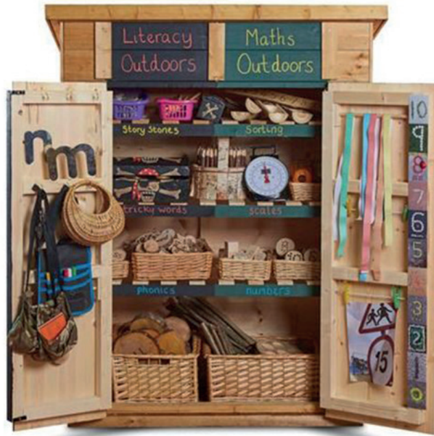
Casita almacenaje por secciones

Este cobertizo combinado se divide para crear dos secciones claras que permiten el almacenamiento de ambos tipos de recursos, sin la confusión que a menudo acompaña el uso de un espacio compartido conjunto. Accesorios no incluidos. Medidas: 115x155x 56 cm. (ancho x alto x profundo).