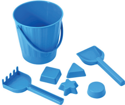
Juego 7 piezas

Conjunto de 7 piezas para jugar en la arena, especialmente diseñado para los más pequeños. Muy resistente. Contiene: 1 cubo de Ø 14 cm., 1 pala de 17 cm., 1 rastrillo de 17 cm. y 4 moldes de 5 cm.