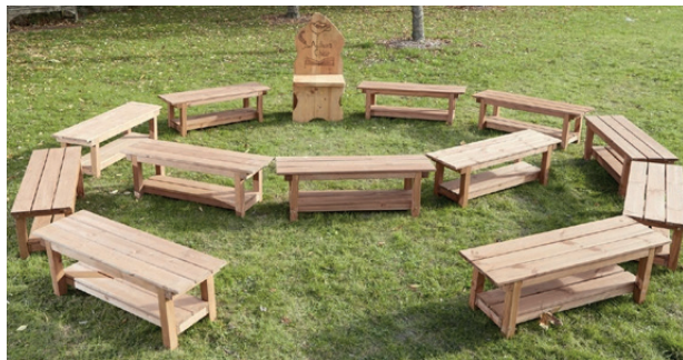
Kit de 12 bancos para exterior

Conjunto de 12 bancos para un grupo de hasta 36 niños/as. Diseñados para promover el aprendizaje al aire libre. Estos bancos naturales permitirán que grupos más grandes se sienten al aire libre para demostraciones o lectura de cuentos. Medidas: 35 x 100 x 30 cm. (largo x ancho x alto).