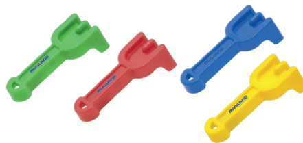
Rastrillos bebé 13 cm. MD29016

Máxima resistencia y durabilidad. Mango reforzado. Especialmente indicado para uso colectivo.