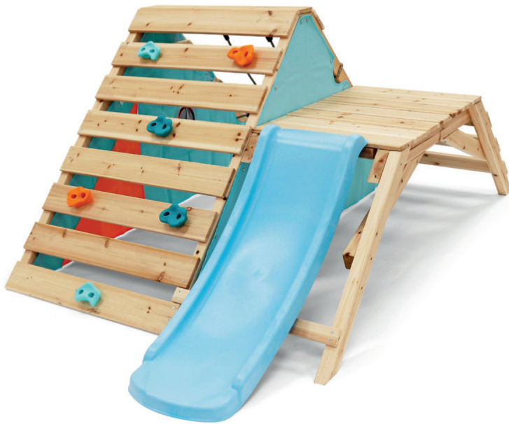
Mi primer centro juego madera

Con este centro de juego de madera, los pequeños aventureros podrán vivir mil hazañas, pues podrán escalar, descender, esconderse en la guarida o explorar el mundo desde las diferentes alturas que ofrece.