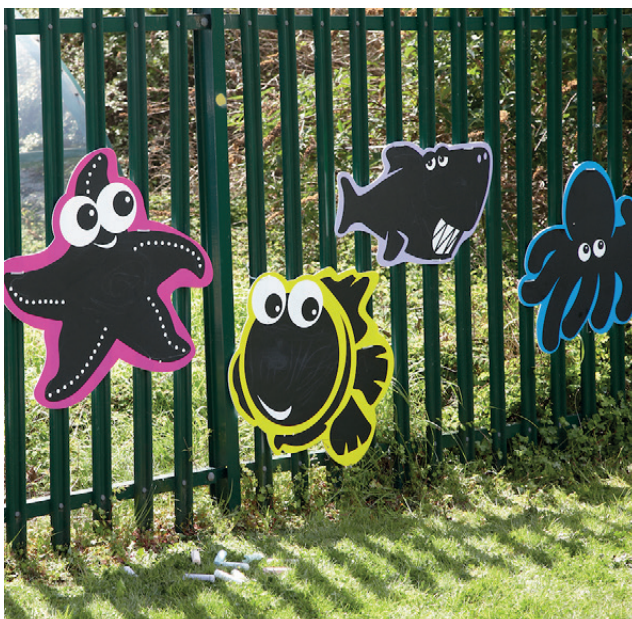
5 Pizarras Insectos

Dimensiones: 74x74 cm. (altura x anchura).