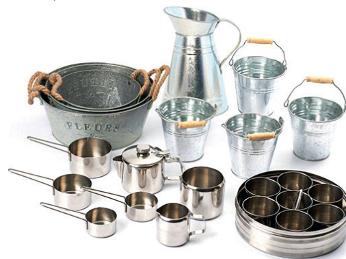
Kit 20 elementos cocina exterior

Kit de 20 herramientas para hacer tus primeros experimentos en la cocina. Puedes verter agua en ellos, arena, y transportarlos donde quieras.