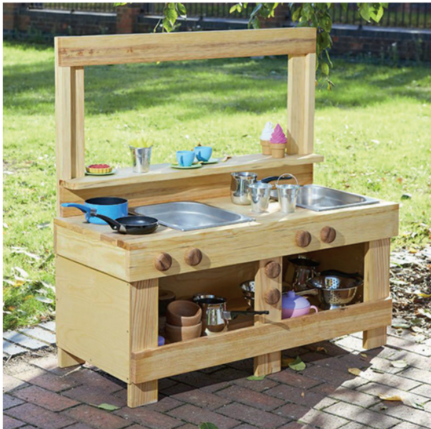
Cocina cafetería de exterior

Esta cocina-cafetería ofrece dos fregaderos, así como almacenamiento debajo para ollas y sartenes. También dispone de una pizarra en la parte delantera, donde puedes escribir el menú, o la especialidad del día. Incluye fregaderos de acero inoxidable. Dimensiones: 146,5 x 99 x 100 x 42 cm. (altura fregadero x altura total x largo x profundidad).