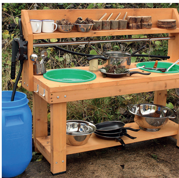
Mesa exp. con bomba agua

Esta mesa es una gran solución para combinar juegos de agua y experimentación con materiales naturales. Esta mesa con 2 agujeros de Ø 33 cm. con bomba inteligente y estación de cocina permite a los pequeños agregar agua a las plataformas para jugar y experimentar. Fomenta las habilidades motoras gruesas, así como la resolución de problemas. Medidas: 100 x 44 x 120 cm. (alto x profundidad x ancho).