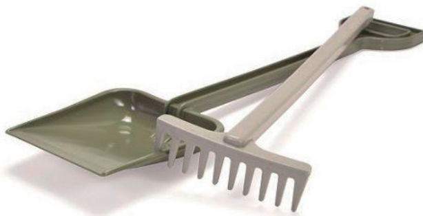
Set pala y rastrillo

Conjunto de pala y rastrillo fabricados 100% con plástico reciclado. Los colores pueden variar. Medidas: 50 - 42 cm.