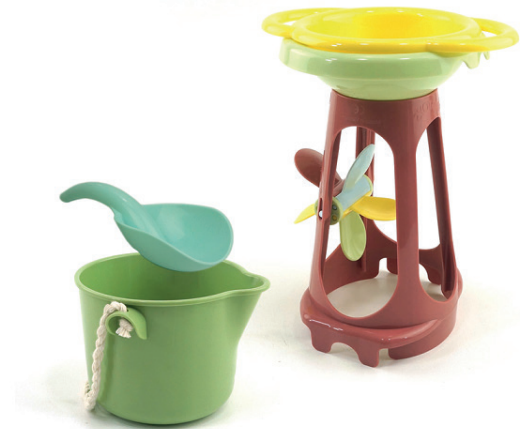
Ecoline sand mill sieve & bucket

Tamiz y molino de arena hecho con recursos renovables, 90% de biobase de caña de azúcar. Una opción perfecta para un juego infantil sostenible.