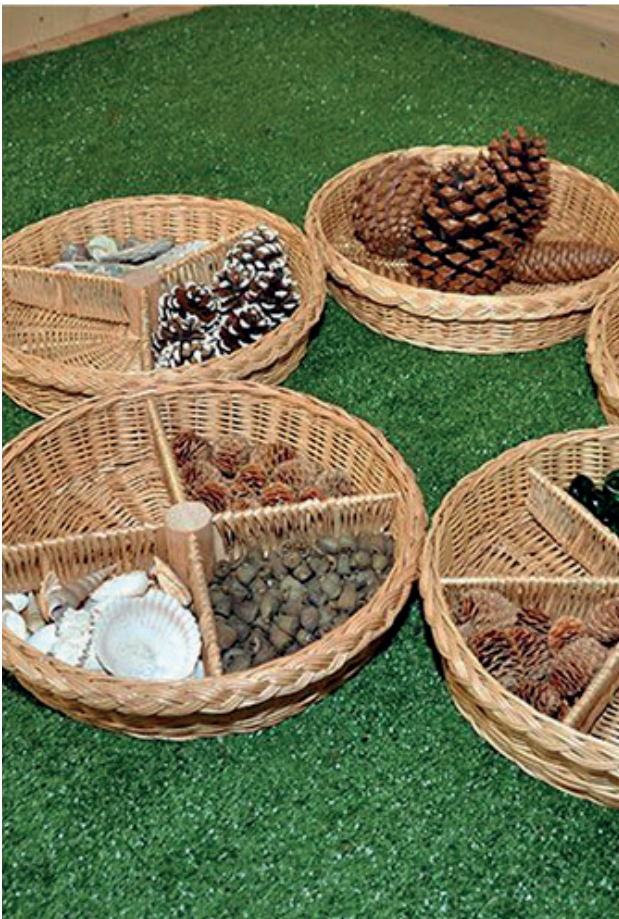
5 clasificadores redondos mimbre

Pack de 5 clasificadores de mimbre con 6 secciones. Ideales para almacenar distintos tipos de materiales. Ø 32cm.