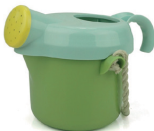
Regadera Ecoline sand watering can

Regadera resistente hecha con caña de azúcar. Producto eco-friendly, reciclable y sostenible. Medidas: 23x16,8x15,7 cm.