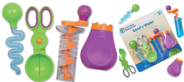
Herramientas para arena y agua

Set de actividad ideal para mesas de arena y agua. Cada herramienta se enfoca en fortalecer los músculos centrales de las manos y los brazos.